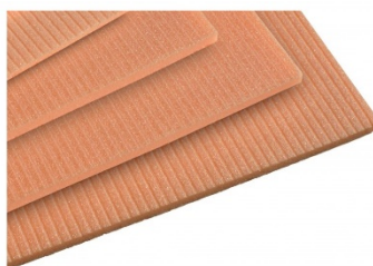
ISOLAMENTO XPS 6MM