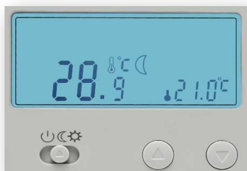
Exemplo do Visor LCD do Thema TD-31